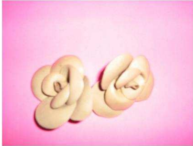
Модель 4. (фото 4).

Штучна квітка-брошка з синтетичного матеріалу.